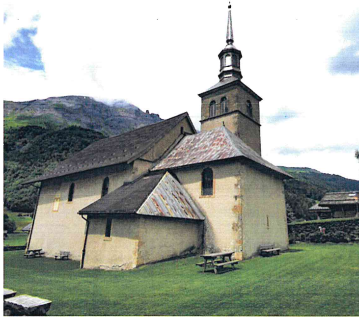
Localisation du bâtiment (une vue depuis l'angle SW).