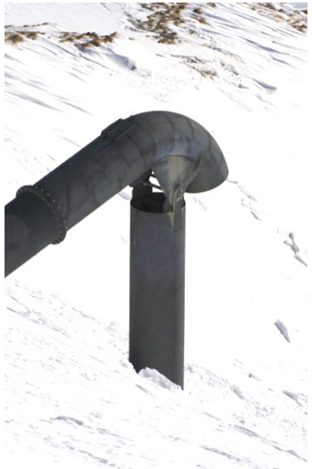
Photographie d'un explosif Gasex, système utilisé par la SECMH dans le cadre de déclenchements préventifs d'avalanches (PIDA)