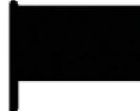
Risque très fort