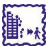
Eloignez vous des bâtiments