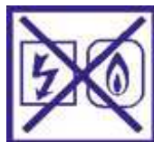
Coupez le gaz et l'électricité