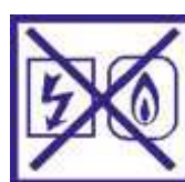
Coupez le gaz et l'électricité