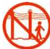
Ne restez pas sous les lignes électriques