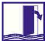
Fermez les portes et aérations