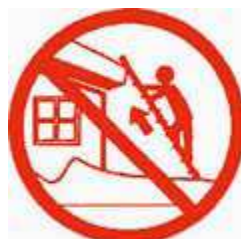
Ne montez pas sur un toit