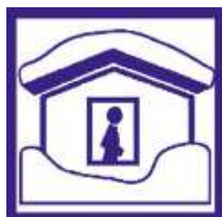
Abritez-vous sous un toit solide