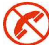
Ne téléphonez pas, libérez les lignes pour les secours