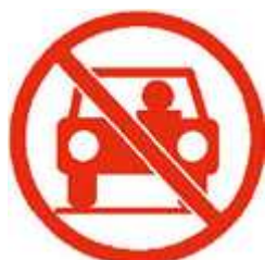
Ne prenez pas votre véhicule