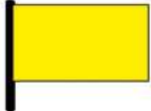
Risque faible et limité

Si vous voyez une pancarte ou un drapeau qui indique un danger, respectez-les.