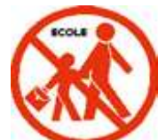
N'allez pas chercher vos enfants à l'école : le personnel enseignant s'occupe d'eux.