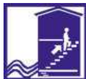
Montez à l'étage