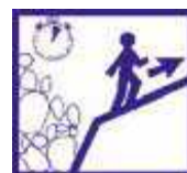
Gagnez un point haut