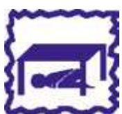
Abritez vous sous un meuble solide

Méfiez-vous des répliques sismiques, elles peuvent causer des dégâts supplémentaires