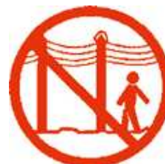
Ne stationnez pas sous les lignes électriques