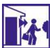
Evacuez les bâtiments