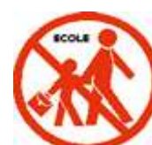
N'allez pas chercher vos enfants à l'école