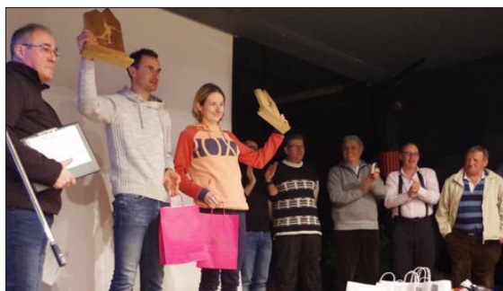
Les deux gagnants sur le podium du challenge Emmanuelle Claret.

Organisée par l'ASND (Association sportive nationale des douanes), le challenge le biathlon a regroupé 26 directions des douanes françaises.