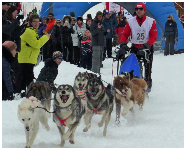
Au départ des attelages, les chiens étaient surmotivés pour accomplir la meilleure course possible. Même enthousiasme chez les chiens participant au canicross. Des canidés bien préparés avant les épreuves, avec notamment la pose de petits chaussons pour ne pas abîmer les coussinets.