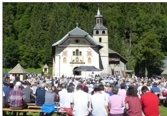
La messe en plein air devant Notre-Dame.

Suite à cette représentation, un feu d'artifice tonitrueux et étoilé a retenti au-dessus de l'église sous les exclamations d'un public ravi.