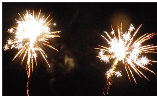
Pour clore cette belle soirée, le traditionnel feu d'artifice, pour enflammer l'assistance.