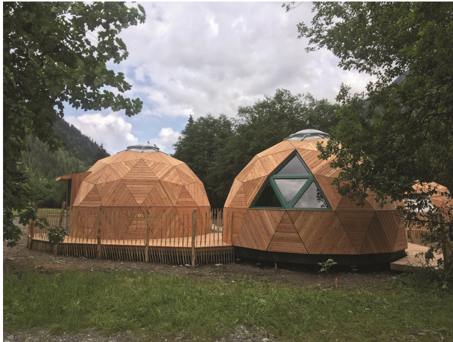
Les dômes Nature Réserve Naturelle les Contamines