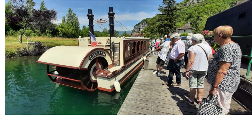
Sortie de nos anciens Lac de Chanaz