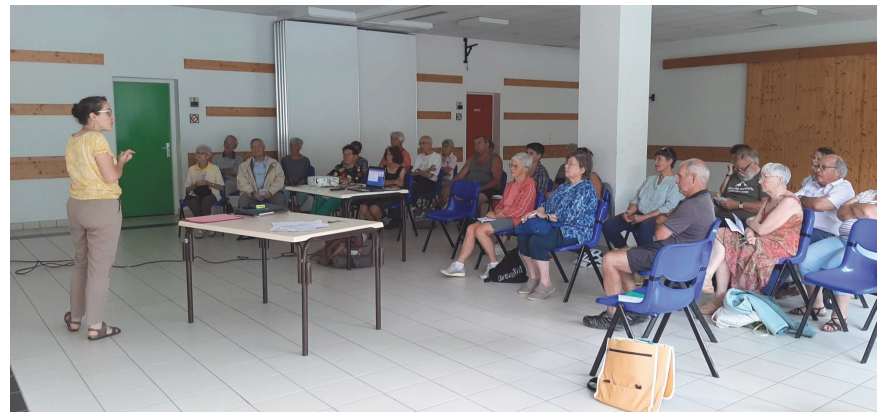
Présentation des Ateliers Numériques