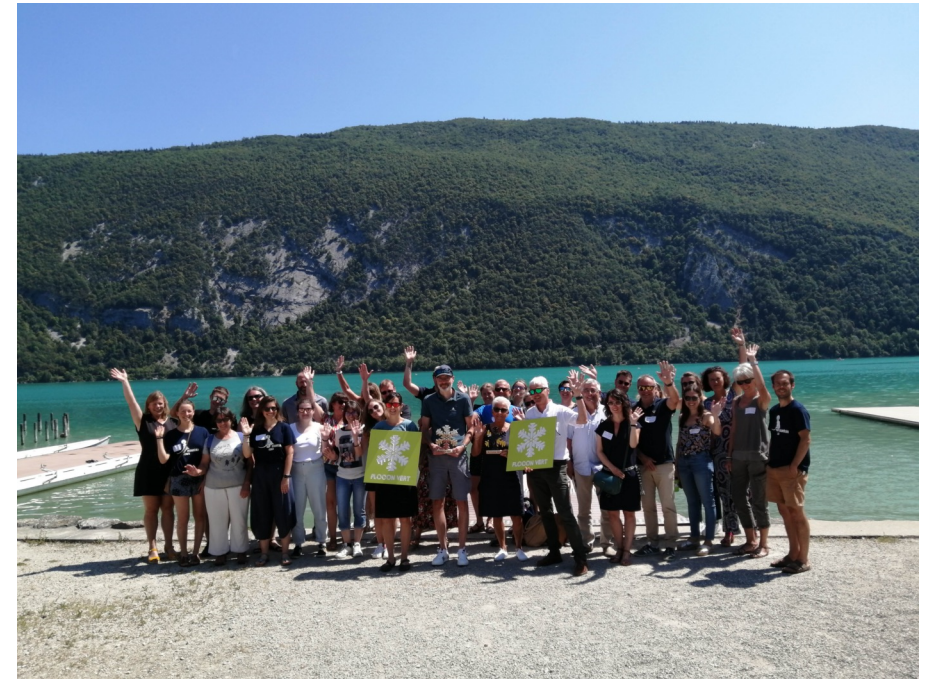
Obtention du label Flocon vert